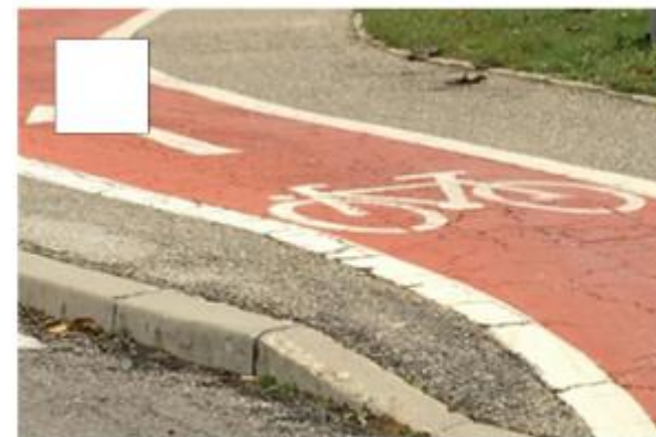
Novo kolesarske poti