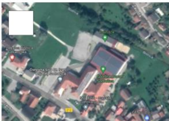
Športnih in rekreacijskih površin