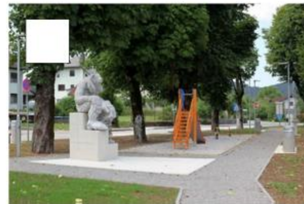
Zelenih površin in parkov z igrali