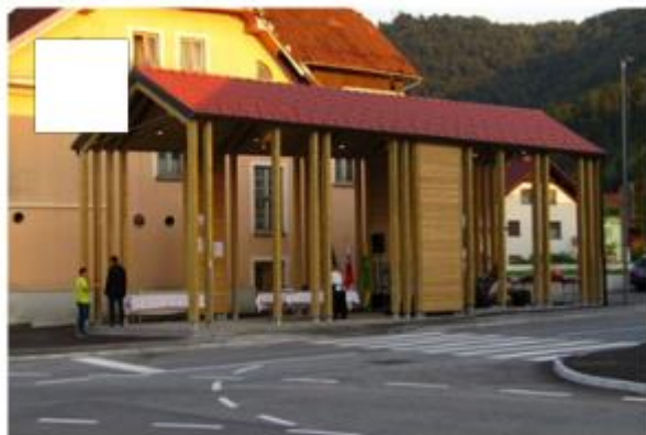
Ponudbe lokalnih pridelkov

10. Česa si želite več v občini Sodražica? Označite lahko več odgovorov.