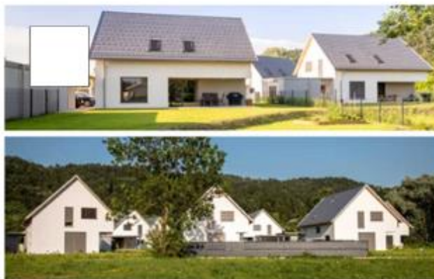
Okolja enostanovanjskih hiš