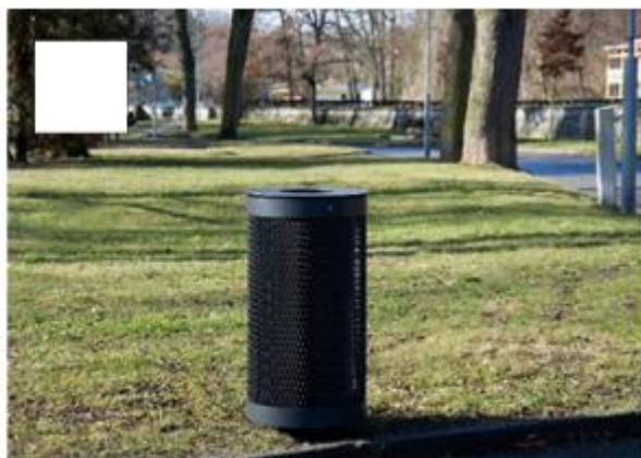
Več košev za smeti