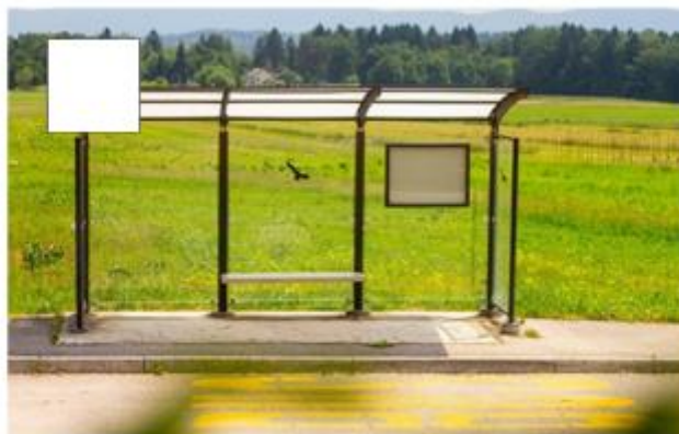
Več povezav javnega pot. prometa