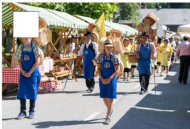
Prireditve in družabnih dogodkov