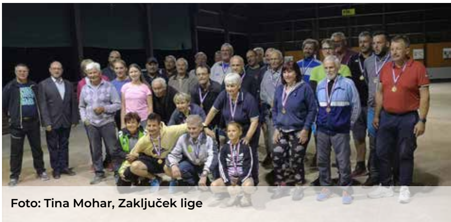
Zaključek lige