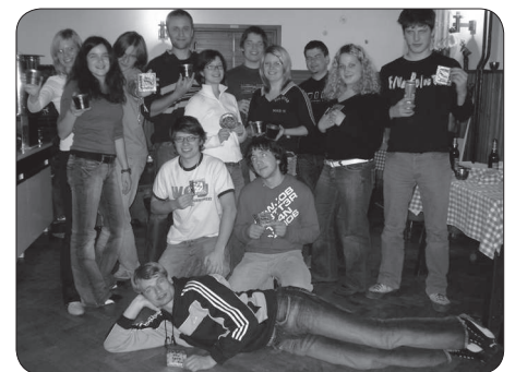
Forum mladih na Travnih gori