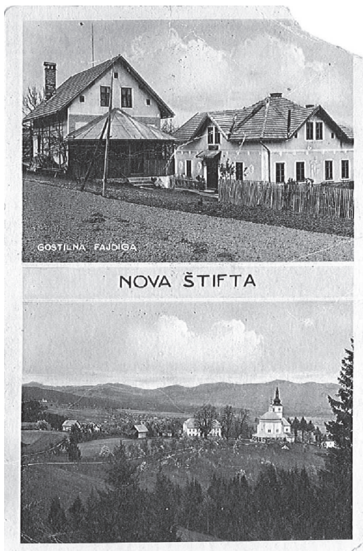
Razglednica Nova Štifta, poslana 1940, v času ko je bila še gostilna na Novi Štifti

Kmalu po pozidavi je Nova Štifta dobila tudi svojega duhovnika in božja pot je zelo zaslovela. Odslej je cerkev