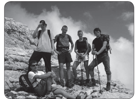
Pohod na Grintovec