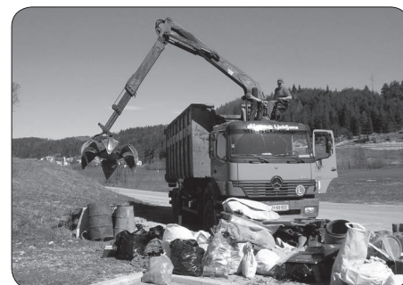
Lanske napake s starim železom nismo ponovili