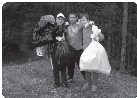
Nova Štifta - v zeleno vrečo steklo, v belo embalažo, v črno ostalo ...