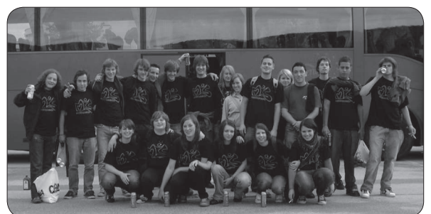
Izlet na Pivo in cvetje