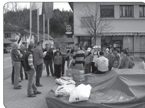
Zbiranje udeležencev na trgu, navodila za ločeno zbiranje odpadkov