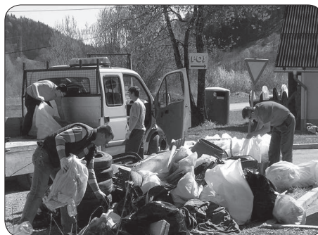
Bojan: Zaupanje je dobro, kontrola še boljša