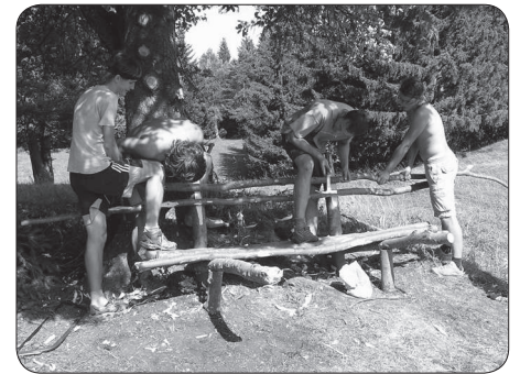
Izdelava klopc na Travnih gori

Ob tem pa vabim vse mlade, da se nam pridružijo. Trenutno se morda zdi to malo težje, vendar ko bomo uredili klubske prostore, nas boste lahko našli tam. Zaenkrat pa nas lahko obiščete na naših projektih ali pa nas kontaktirate preko e-pošte: mladinski.klub@gmail.com . Ne bojte se, ne grizemo!