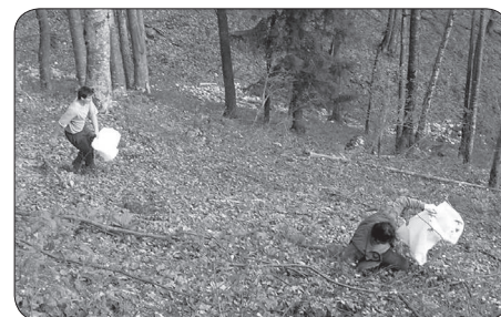
Specialca na strmih pobočjih Travnne Gore