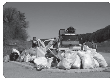
Začasna deponija in sortiranje odpadkov