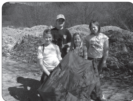
Malo starejše/-ši na Sedlo in čez Jelovec mimo ribnika proti Sodražici