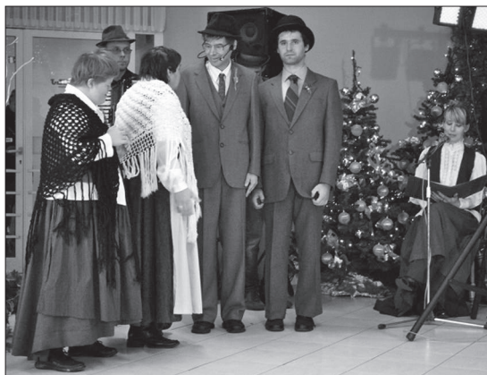
Prizor iz igrice Kako se je možila Taprisrčna Johanca