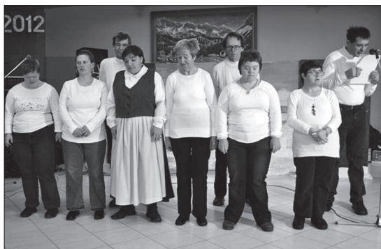
Varovanci VDC Ribnica ob izvedbi šopka pesmi

Najava razpisa za sprejem otrok v vrtec pri OŠ Sodražica za šolsko leto 2012/13