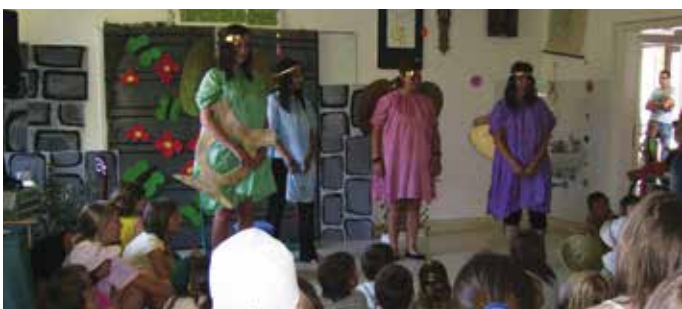
Oratorij 2010 – PAZI, ČAS!