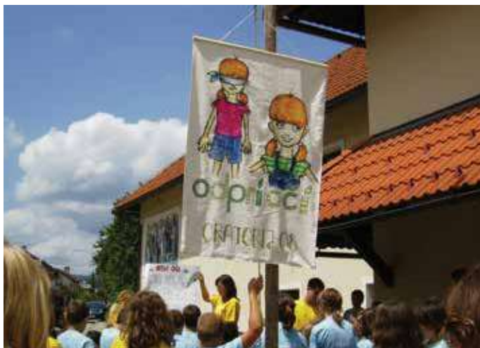
Oratorij 2008 – ODPRI OČI

Otroško veselje, igre, bansi, ustvarjanje na delavnicah, petje, ples, pogovori, vodne igre, blatne igre, pohodi v naravi, izleti ... Urice prijetne utrujenosti in radoživosti voditeljev, animatorjev in otrok lepo in koristno obarvajo vse dneve oratorija. Včasih se animator uči tudi od starejših, ki že imajo izkušnje in tako lahko že napreduje v voditelja (voditeljico), ki potem skrbi tudi za animatorje. Biti animator pomeni razdajati se in vsaj toliko, ali celo več, tudi prejemati. Biti oratorijski animator zagotovo pomeni spreminjati svet na boljše, kar si želimo vsi.