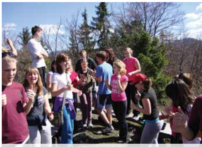
Oratorij 2011 – V TVOJO SMER