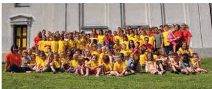
Oratorij 2009 – NATE RAČUNAM