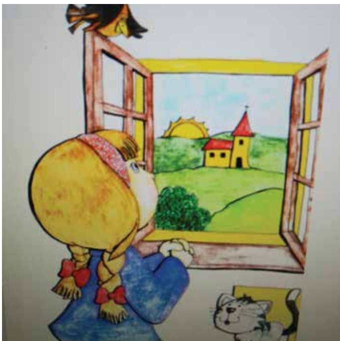
Oratorij 2012 – GREM JAZ