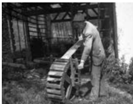
Jože Rasket iz Zakriža pri Grču krivi obod na kolesu za obode. Slovenski etnografski muzej, Boris Orel, F-0000011_215.