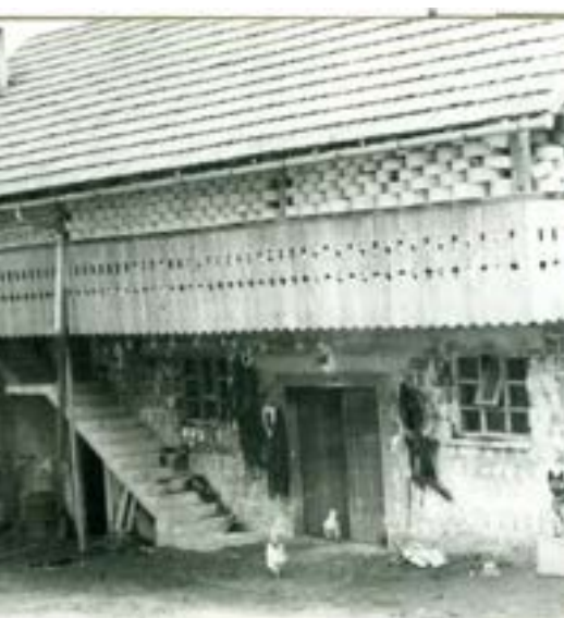
Sušenje obodov na ganku nad hlevom pri Tanovih na Prapročah. Etnološki tabor Slemena 2014 – Praproče. Muzej Ribnica, digitalno.