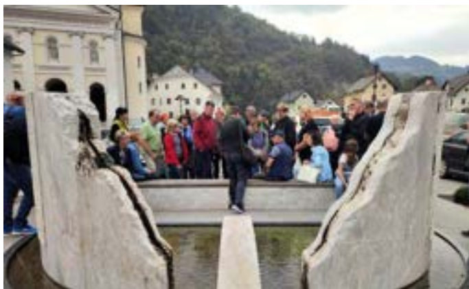
Voden ogled po Železnikih, kjer smo v družbi lokalnega vodnika izvedeli veliko zanimivega o mestu.

Z lepimi vtisi in spomini celega dne smo se vrnili domov. Naj nas Groharjeve slike o naravi in njeni lepoti spremljajo še dolgo.