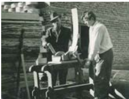
Mašinarje obodov v Sodražici pri Lovšinovih.