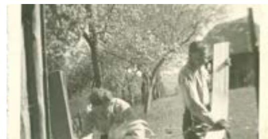
Izdelovanje obodov na vrtu. Etnološki tabor Slemena 2016 – Krnče.