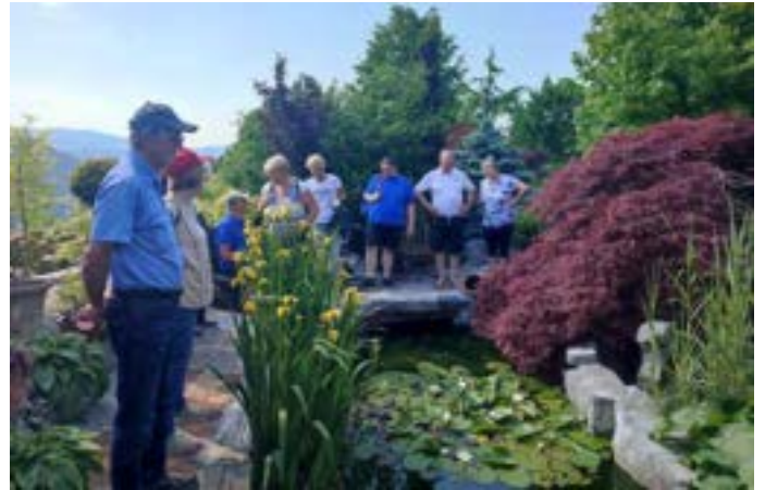
V Loškem Potoku gotovo ne gre izpustiti čudovitega okrasnega vrta družine Knavs.

Z obilico novega znanja, izkušenj in očaranosti nad vidnim in slišanim smo zaključili naš uspešen popoldanski izlet, na katerega nas bodo še dolgo spominjale posnete fotografije.