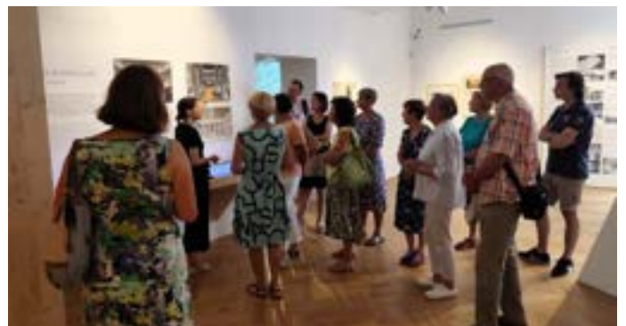
Kljub temu da smo v društvu že večkrat dan ali dogodek posvetili slavnemu arhitektu Jožetu Plečniku, nas uspe vsakokrat znova navdušiti.

V ospredje postavlja Plečnikov arhitekturni opus ter obiskovalcu predstavlja najrazličnejše inovativne ideje in tehnike, ki jih je uporabljal pri svojem ustvarjanju. Na razstavi smo spoznali različne Plečnikove projekte, tako realizirane kot tudi tiste, ki so ostali le v načrtih; ogledali smo si makete, intimne skice, načrte in zapise, med katerimi nekateri sploh še niso bili nikoli razstavljeni.