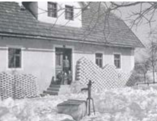
Pred obodarsko hišo na Marolčah. Etnološki tabor Slemena 2016 – Marolče.

Več o obodarstvu lahko izveste v knjigi Obodarstvo , ki je dostopna v fizični in elektronski obliki.