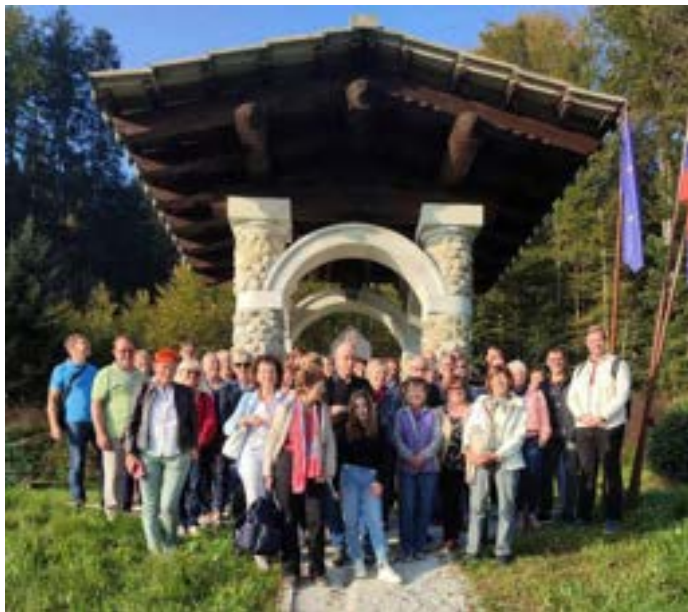
Plečnikov spomenik pred Dolenjo vasjo, ki je posvečen žrtvam nacizma v 2. svetovni vojni.